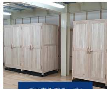
収納庫免震テーブル