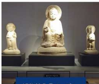
博物館免震テーブル