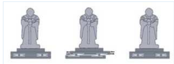
[免震装置を設置している場合]