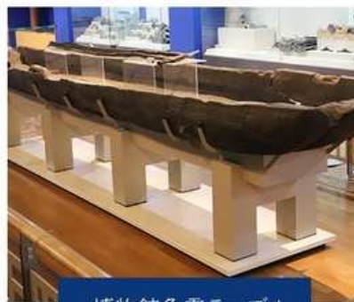
博物館免震テーブル