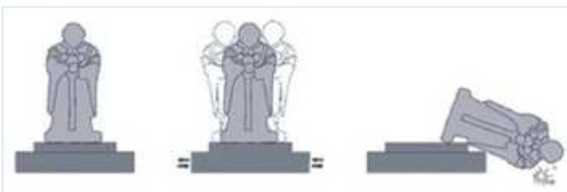
[免震装置を設置していない場合]

工事が不要 で、ただ置くだけで地震対策が可能。さらに、 地震後のリセット作業も不要 です。移設や文化財の増設にも柔軟に対応でき、設計が簡単で、複数装置の連結も可能です。