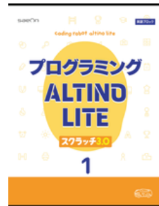
[情報 I 対応]