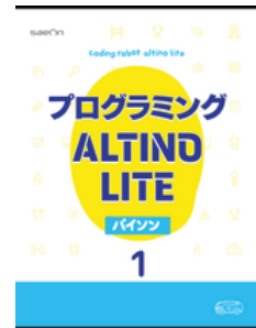
[情報 II 対応]